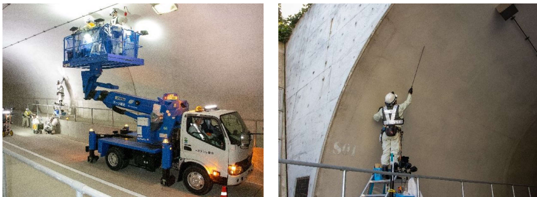
写真 2-1 初回点検状況