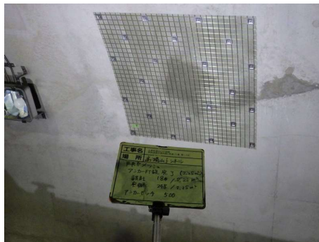
写真 3-1 FRP ネット設置状況（他トンネルの事例）