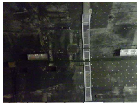
写真 3-2 導水桶工設置状況（他トンネルの事例）