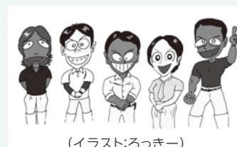
(イラスト:ろっきー)