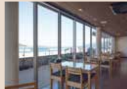
海に面した食事処

新鮮な魚介類が並ぶ直売所、海峡料理を楽しめるお食事処、情報コーナーでは観光案内も。上関を訪れたら、かならず立ち寄りたいスポット。