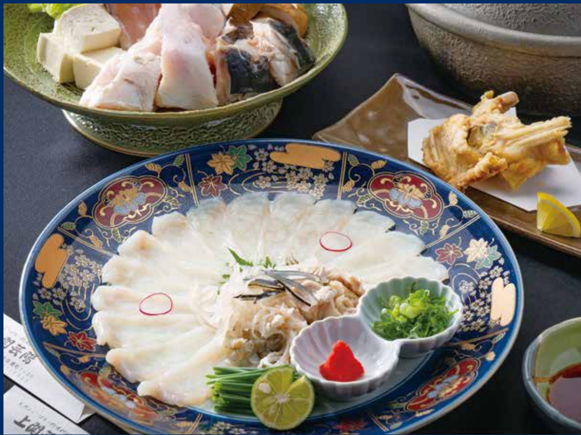
上関芸陽の店舗では、季節の天然魚にこだわった料理を楽しめます

東京・広島の名店で上関直送の四季の味が楽しめる食事券 に加え、ご自宅で味わえる天然とらふぐセットもご用意