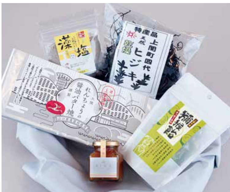
A-21 詰め合わせ例 詰め合わせ商品は季節により変わることがあります