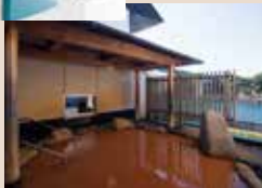
紅湯で芯から温まる