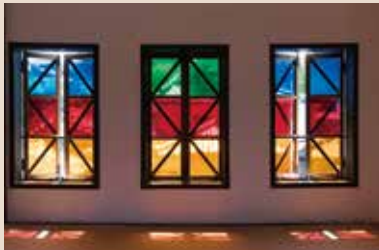
ステンドグラスと畳の和モダンな4階

開館時間：10:00～17:00(入館は16:30まで) 休館日：毎週月曜日(祝日を除く)、 祝日の翌日、年末年始/入館料無料 山口県熊毛郡上関町室津 868-1 TEL: 0820-62-6040