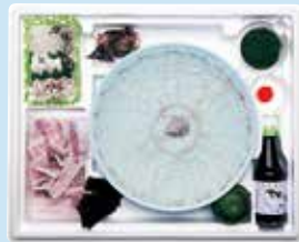
食卓で歓声があがる、ふくコースをご自宅で

銀波荘は、夏は鯉、冬は天然とらふく料理がいただける上関の老舗旅館。ご主人の確かな技で丁寧に造られた季節の旬のコース料理をゆったりとした座敷でいただくお食事券と、鯉やふく料理をご自宅で味わえる嬉しいセットをお礼の品としてご用意。セットには特製ポン酢や薬味が付いており、食卓で手軽に贅沢なコースを味わえます。大切な方へのギフトにも。