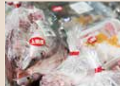
毎日新鮮な品が並びます