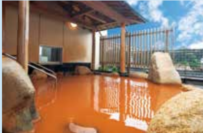
紅湯の露天が自慢の「鳩子の湯」入泉券つき