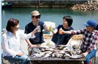
天気の良い日は、海を見ながらバーベキュー

手ぶらで気軽に上関の海を満喫できるツアー。釣り道具の用意も不要、初心者でも楽しめる五目釣り体験の後は、とれたて地魚の極鮮浜料理を堪能！お腹が満ち足りたら、上関海峡温泉「鳩子の湯」で海を眺めながら癒しのひととき。お土産にも地魚つき、大漁保証の上関を丸ごと楽しむ、遊漁ツアーです。