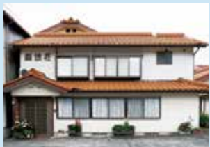
とらふくも鯉も、自分の目で選んで捌きます。上関にもどうぞお越しください。