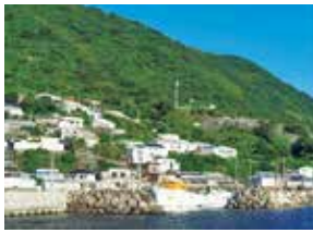
ゆったりした時間が流れる祝島

祝島から、瀬戸内の太陽とミネラルたっぷりの潮風を浴びた 季節の恵みをお届け！ 名産のびわ、ジューシーいよかん、定番みかん