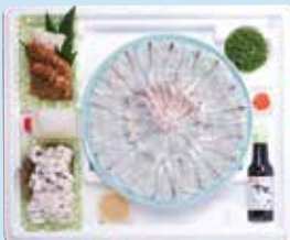
皿にきれいに盛り付けられ、そのまま食卓に。