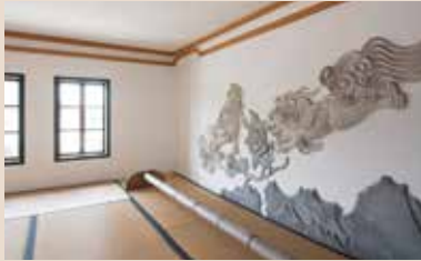
見ごたえのある鍍絵 ごてえ

明治12年竣工の擬洋風木造建築「四階楼」は、外観は漆喰の白壁、4階の窓にはフランス製のステンドグラスの窓、さらに様々な鍍絵が施されており、モダンで豪華な建物からは、当時の上関の華やぎが感じられます。