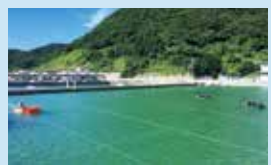
瀬戸内の豊かな海で育てます