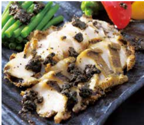
新鮮あわびは軽くソテーしてバター醤油で（調理例）

予定数になり次第、受付終了します。★印の品は、23ページの「配送希望票」をご提出ください。月曜日、祝日明け、年末年始のお届けは不可となります。ご寄附入金後1週間以降の日付でご指定ください。