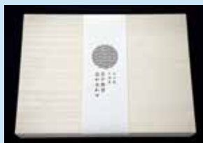
ご贈答用に最適の桐箱入りもご用意。(E-3) 大切な方に。