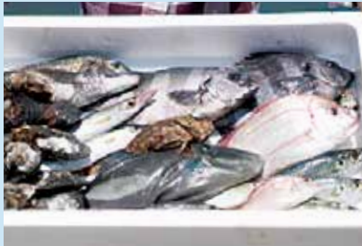
瀬戸内の海は魚種が豊富。お土産もご用意！