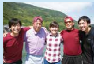
上関をたっぷり満喫できるツアーです！

手ぶらで気軽に上関の海を満喫できるツアー。釣り道具の用意も不要、初心者でも楽しめる五目釣り体験の後は、とれたて地魚の極鮮浜料理を堪能！お腹が満ち足りたら、上関海峡温泉「鳩子の湯」で海を眺めながら癒しのひととき。お土産にも地魚つき、大漁保証の上関を丸ごと楽しむ、遊漁ツアーです。