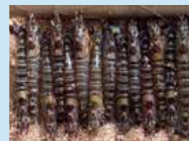
食べごたえのある特大サイズ