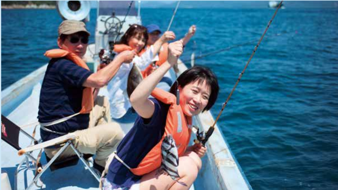
瀬戸内の潮風が心地いい！初めての方にも安心、グループで釣り体験を！