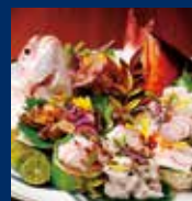
鮮度抜群の魚介類