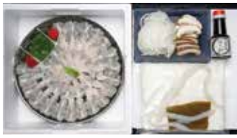
C-5の鱧しゃぶセット 45,000円以上の寄附