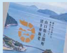
上関の風土が伝わる専用箱