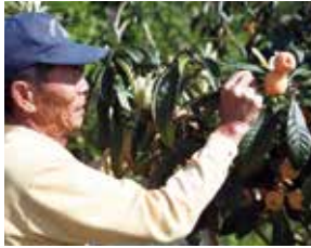
びわは一房ずつ袋掛けして