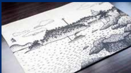
↑山下清画伯来店時の絵

予約制で営業。 新鮮なとらふくを代々受け継ぐ技で調理。人気のふく刺しのほかに焼きふく、飲物なども含まれるコース料理2名様分のお食事券を10組限定で。