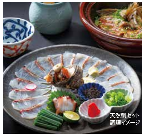
天然鯛セット 調理イメージ

上関直送天然魚料理の名店「上関芸陽」の味をご自宅で味わえる鍋セット。天然鯛セット、夏の味覚・鱧しゃぶセットの2種に、贅沢な一人鍋を楽しむハーフセットもご用意。手軽に名店の味をお楽しみください。P7では、天然とらふぐセットもご紹介。