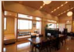
身体もお腹も満足

露天の紅湯の他に内湯の白湯やサウナ、貸し切りできる家族風呂も完備。リラックスした後は、眺めのいいお食事処で、海の幸を満喫したい。