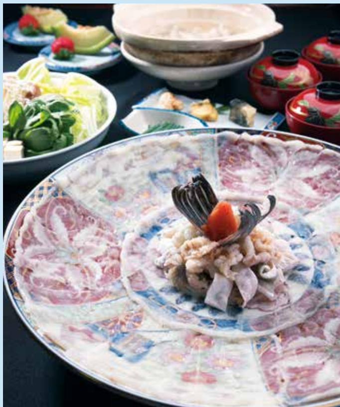
冬期のお食事券で、天然とらふくコースを。