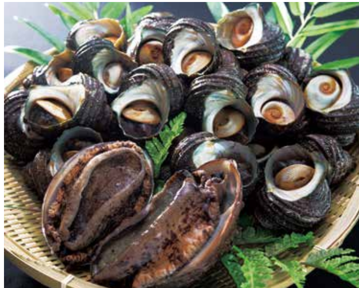
上関の海の幸をお届けします！