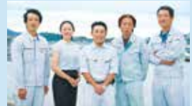
自慢の車海老をご賞味ください！