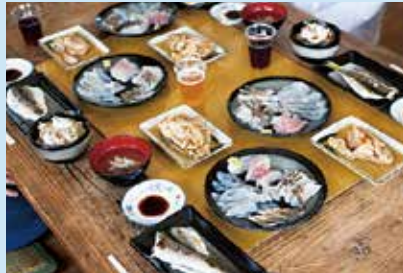
漁師自慢の海の幸づくしのお食事を