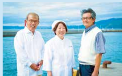
上関のベテラン料理人がタッグを組み共同開発したお墨付きの逸品

出品者：カイキョー館・銀波荘 内容：上関産魚介類の灰干し5種 申込：通年 配送：通年