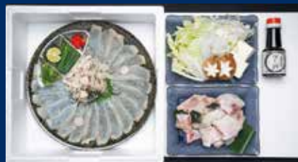
J-1 とらふぐセット。薬味やポン酢もお届け

東京と広島に店舗を持つ「上関芸陽」は、上関直送の天然魚を使った料理が評判の名店。そのお食事券をお礼の品としてご用意しました。寄附額に応じて2種類、お店を選んでご予約ください。 さらに、「上関芸陽」の料理をご自宅で楽しめる「天然とらふぐセット」も登場。 HALF セットはお一人様向け。気軽に贅沢な鍋を楽しめます。 12ページには、天然鯛や鰹セットもご紹介。上関の旬の魚をご堪能ください。