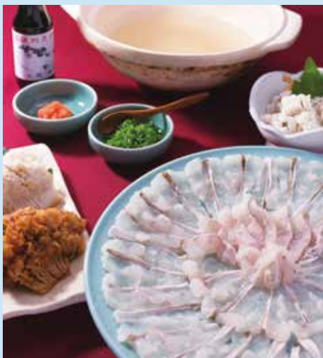
骨がないと言われるほど、丁寧な仕事の鯉しゃぶセット。

上関の海の恵みをゆったりと、ホームパーティーで賑やかに 確かな技と心遣いが伝わる、冬のとらふく、夏の鯉