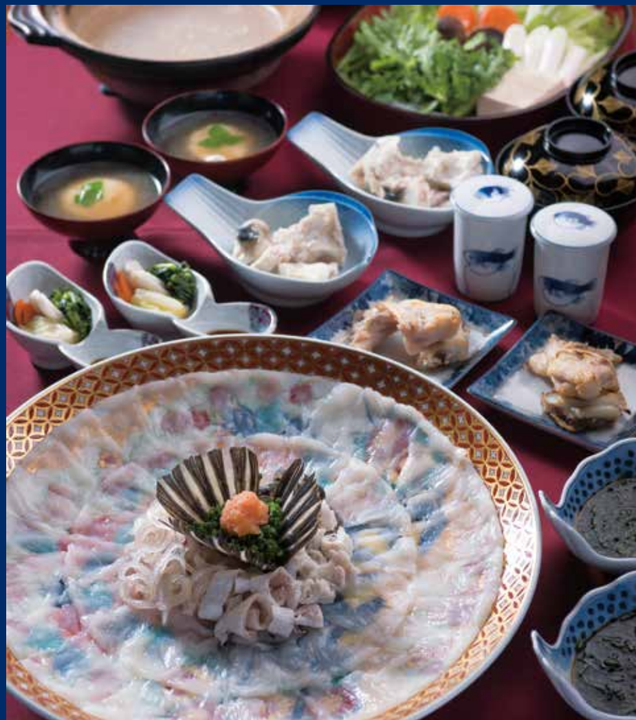
↑コースはふく刺身、塩焼き、ちり鍋、吸い物、おじや、香の物、果物。 ふくだけでとったダシで、鍋と別におじやを作るこだわりの味。

上関の海で獲れた新鮮な天然とらふく料理に魅せられて、政財界・文化人も足を運ぶ「田中旅館」。ふく料理が評判となり、旅館の名は残しながら、ふく料理専門店としてふくが獲れる時期のみ完全