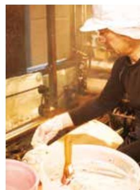
地元の白身魚を早朝からすり身に。一つずつ手揚げする品も

創業100年の鳩子てんぷら。毎朝水揚げされる地元の魚を、早朝まだ暗いうちからすり身にする作業が一日の始まりです。代々受け継いだ手仕事を大切に、家族ぐるみでつくるてんぷらには、素材の味が活きています。