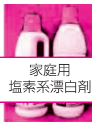
家庭用 塩素系漂白剤

この冬のノロウイルスは、変異性のウイルスも現れ、各地で例年よりも早くから流行しており、感染性胃腸炎と診断される人も少なくありません。ノロウイルスは、石けん、逆性石けん、エタノール類では消毒できません。「加熱」と「次亜塩酸ナトリウム」が有効です。次亜塩酸ナトリウムは、家庭用で市販されている台所用塩素系漂白剤（原液の濃度約5%）に含まれており、薄めて使用します。