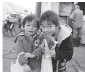
◀石焼き芋が登場。うまうまい♪