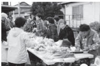
▲雨の心配もなく、青空市場でした。