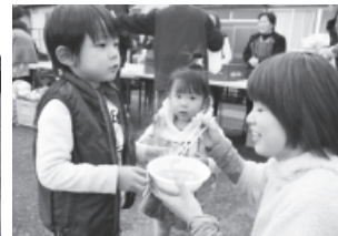
▲豚汁のサービスに舌鼓。あったまるぅ～！