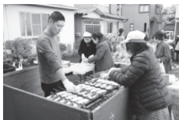
◀たい焼きはいつも好評です。