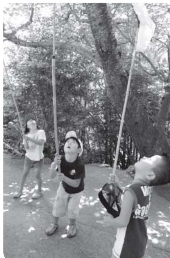
せみとり(8月) 「せみさん、どこにいるの〜?」