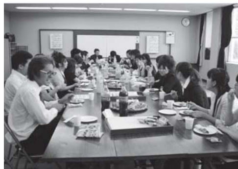
ガンバレ、二十歳の若人たち！

『成人式を迎えられたのも家族や地域の方々の支えがあったからこそ。感謝の気持ちでいっぱい。大好きな同級生、仲間と共に迎えた一生に一度の成人式。この宝物を人生の糧として頑張ります。』