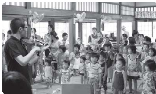
▲バイオリン mini コンサート (8月18日) 繊細なバイオリンの音色にうっとり♡

◀プール 上小プールでたくさん 泳いだよ。 「飛び込みだって できるんだ!!」 (7月下旬〜8月上旬)