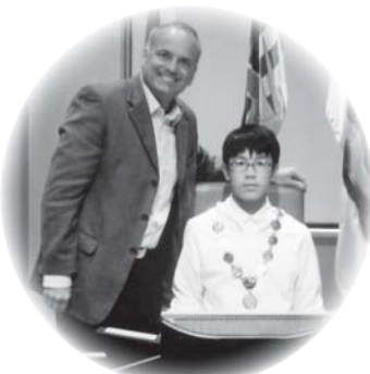
市長さんを表敬訪問しました

最後に、海外派遣事業に参加させていただき、関係者の方々の温かい支援に感謝いたします。本当にありがとうございました。