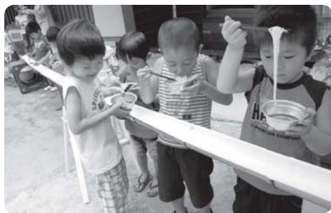
そうめん流し(8月18日) 「冷たいそうめん、最高〜 おいしくい♡」