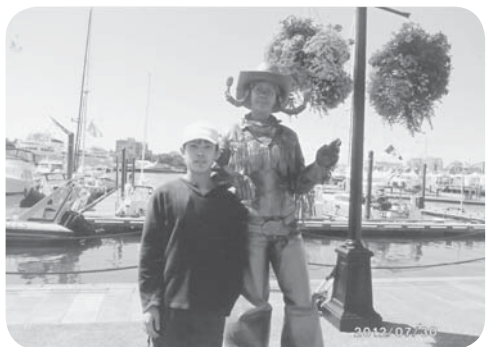
◀バンクーバー島で大道芸人の人達と