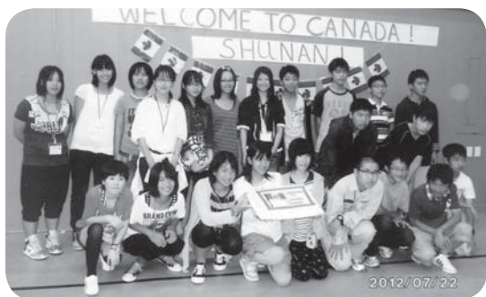
▶最初のウェルカムパーティーで集合写真

カナダの文化を学べたし、英語の学力も少しは高まったと思います。この研修に参加できたことは自分の中ではとても貴重な体験になったと思います。これからもカナダで学んだ経験を活かして、学校での授業や将来に役立てていきたいと思っています。