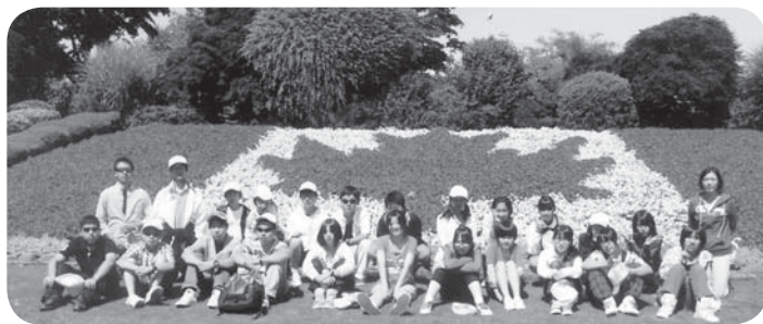
カナダとアメリカの国境で▶