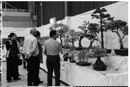
みごとに作品が ずらり