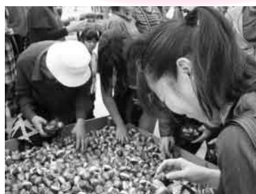
大人気のすくいどり 3コーナー (チューリップの球根・お菓子・さより)