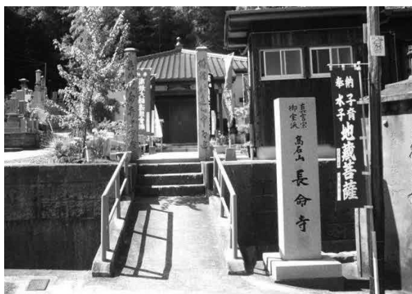
周防大島町 長命寺（正面の宝形造の建物が本堂）

年（1869）、大島郡開作に引寺となり、寺号を廃止する」ただけしか記されていません。