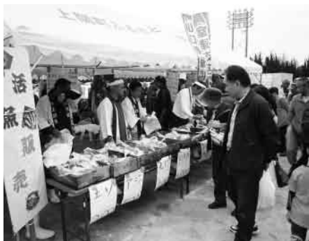
ナービス満点 活魚コーナー