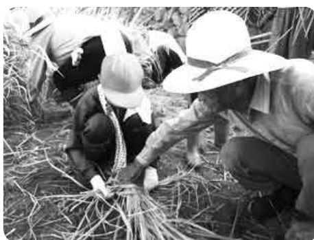
束を結ぶのが一苦勞

でも近づく営みでもありません。秋の一日、子どもたちは体験学習を通して、日本の美徳を肌で感じることができたようです。 年が明けたら、刈った餅米は見事な餅となって、豊かな食文化を私たちにたらしめます。