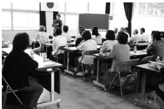
1 回目：「うつ病を正しく知しましょう。」

ゲートキーパーとは、悩んでいる人をうつ病や自殺に追い込まないために、悩みを聞いたり、体調の変化に気づいて関わり、相談窓口や医療につなぐなどの支援をする人のことです。