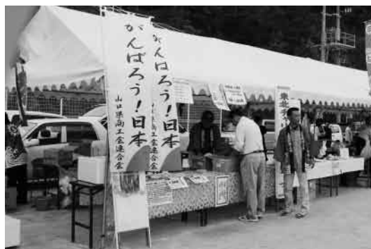
東北チャリティーコーナー