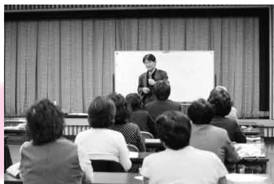
2 回目：「効果的な対応方法を身につけましょう」 ～相手の話をどのように聴くのか？～

参加された方もうつ病に対しての理解が深まった研修会となったのではないのでしょうか。