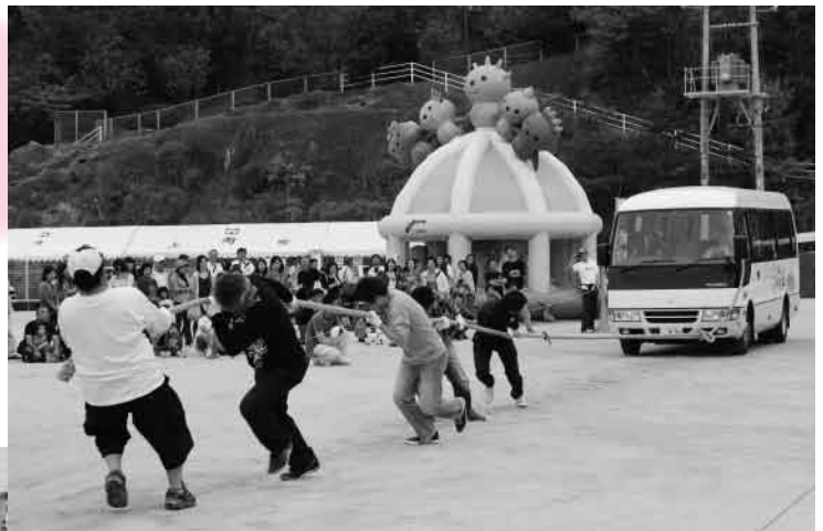
「ひっぱれー！ひっぱれー！」