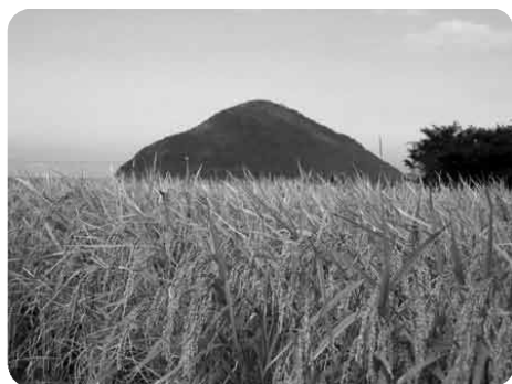
稲穂の向こうに「小祝島」

秋たけなわです。もうじき落葉が進み、心は冬への準備に入ります。学校も霜月から師走へと、2学期末に向けて一層慌ただしさを増しそうです。 さて本校の特色は、ふるさとの伝統や生業を、きわめて身近な体験を通して学ぶことができる点にあることを、これまでお伝えしてきました。 今回も、島の稲作り名人に教わった学習をお伝えしたいと思います。 祝島の三浦湾の沖に、「小祝島」というかわいい島が存在します。すばらしく天気のいい秋の一日、たわわに実った稲穂の向こうに