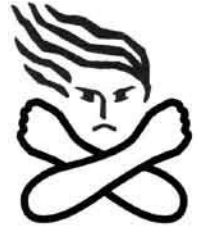
女性に対する 暴力根絶のための シンボルマーク

配偶者からの暴力は、犯罪となる行為も含まれる重大な人権侵害です。どのような理由があるにせよ決して許されるものではありません。しかし、配偶者からの暴力は、外部からその発見が困難な家庭内において行われているため、潜在化しやすい傾向にあります。パートナーからの暴力は、決してあなたのせいではありません。また、あなたの努力や愛情で改善されるものでもありません。勇気を出して援助を求めて下さい。