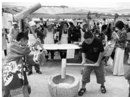
婦人会のもちつき

好天に恵まれ、恒例の愛ランドフェアが開催されました。今年は、東北災害復興支援の一助となればと、物産展やチャリティーコーナーなどを設け、ご来場の皆さんへご協力をお願いしました。とても盛況で完売となり、売上金を福島県へ届けます。ありがとうございました。 勇壮な「水軍太鼓」で祭りの幕開けです。ステージでの催しは、園児や小学生の遊戯、フラダンス、沖縄民謡やズーチャンベライブなど、素晴らしい演技や演奏で場内は盛り上がりました。 各コーナーには、上関産の「海の幸、山の幸」がずらりと並び、皆さん、両手一杯買い求めていました。クルマエビや球根つかみ取りは人気で、長蛇の列ができていました。「毎年楽しみに来ています!」と光市や柳井市、周南市等から来場されたとか。