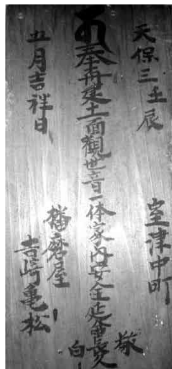
十一面観音菩薩の墨書木札

られました。早速、本堂に案内され、ご本尊の薬師如来立像に合掌し、この左脇の厨子に鎮座する十一面観音菩薩を拝観させていただきます。胸がたかぶる思いです。