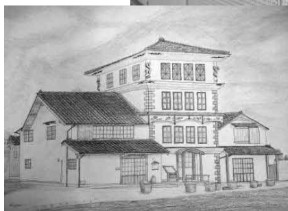
愛・ランドフェアでの作品展示