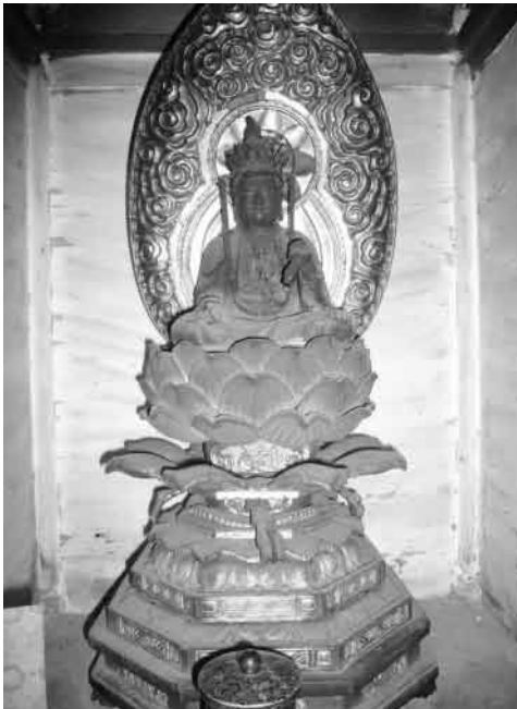
明治2年に移された十一面観音菩薩

室津長命寺の本堂が新しく建て替えられたのでしょうか。それにしても、母親のようなやさしい愛に満ちた心で私たちを救済してくださる十一面観音菩薩が、室津から周防大島の地に、受け継がれ、大事にまつられていることはありがたいことだと思います。『上関町史』に「本尊は地藏菩薩」とありますので、ご住職にお聞きすると、海外へ流出したと聞き及んでいるとのことでした。 明治6年（1769）以来、当地に小松塩田祈禱所、自性院がありましたが、明治2年に室津長命寺を移転、合併し、高石山、長命寺として現在に至っているとのことです。移った理由はよくわかりませんが、明治維新の廃仏毀釈の影響かもしれません。それにしても、数年前までは、室津からマイクروبスで長命寺にお参りされていたそうですから、移転後も相当長い間、室津との縁が続いていたのでしょう。 （注）廃仏毀釈とは、仏教を排斥しようとする政策 『日本史広辞典』