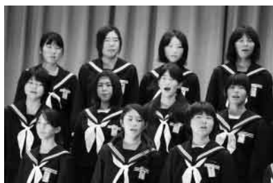
上関中学校全校生徒による合唱