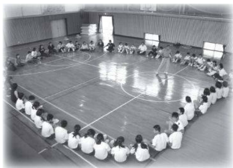
気持ちを集中させて小さなサインを伝達させていくインパルスゲーム

〈地区ふれあい懇談会〉 6月27日(日)、多くの保護者や民生委員さんのご参加のもと、「ふれあい懇談会」を開催いたしました。これは地域の皆様と楽しくふれあいながら連携を深め、様々な意見交換を行うことを目的としています。 当日はNTTドコモ職員による「ケータイ安全教室」でケータイの安心・安全な使い方や、ルールやマナー、トラブルへの対処方法等、フィルタリング（アクセス制限）の必要性を学ぶことができました。 また本校校長による「ふれあいゲーム」、保護者・民生委員の皆様との「合同地区懇談会」を実施しました。終始、あたたかい雰囲気の中で会をすすめることができました。