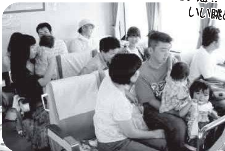
ぐるっと 長島一周 クルージング