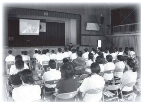
ケータイ安全教室

〈地区ふれあい懇談会〉 6月27日(日)、多くの保護者や民生委員さんのご参加のもと、「ふれあい懇談会」を開催いたしました。これは地域の皆様と楽しくふれあいながら連携を深め、様々な意見交換を行うことを目的としています。 当日はNTTドコモ職員による「ケータイ安全教室」でケータイの安心・安全な使い方や、ルールやマナー、トラブルへの対処方法等、フィルタリング（アクセス制限）の必要性を学ぶことができました。 また本校校長による「ふれあいゲーム」、保護者・民生委員の皆様との「合同地区懇談会」を実施しました。終始、あたたかい雰囲気の中で会をすすめることができました。