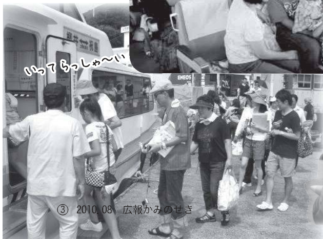
③ 2010.08 広報かみのせき