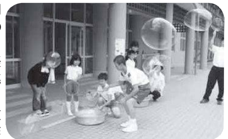
でっか～いシャボン玉

7月29日、上関小学校でミニ科学の祭典が催され、多くの児童と園児達が楽しい実験や工作に挑戦しました。スライムづくり、押し花教室、また竹や紙で作る風車、空気砲の実験、らっかさんや