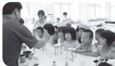
べっこうあめって どんなだろう？

シャボン玉づくりなど、手先を器用に使って楽しい体験をし、また、べっこう飴や簡単アイスづくりで美味しい実験もしました。地域ボランティアの方や先生方お疲れ様でした。子ども達の喜ぶ顔に疲れも吹っ飛んだでことでしょうね！