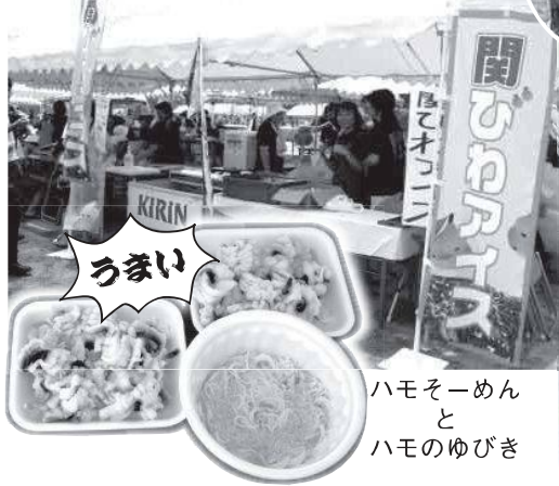
ハモソーめん と ハモのゆびき