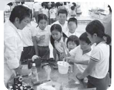
アイス、 どんな味が楽しみ！