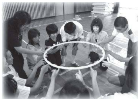
UFOに見立てたリングをみんなで心をあわせて着陸させる地球防衛軍ゲーム

〈不審者対応避難訓練〉 7月6日(火)に生徒に危害を加える不審者が学校に侵入した場合の、危機的な状況に備え、不審者対応避難訓練を行いました。当日は柳井警察署職員が不審者役に扮し、緊張感のある実施訓練となりました。 ①学校の周りをうろつく不審な人物を発見！学校職員がすぐに御用向きを聞きに出ます。 ②職員の制止を聞かず、包丁を取り出し、校舎内にあがってくる不審者。 生徒たちには避難を指示し、職員は生徒が無事避難できるようにさすまたで威嚇、時間稼ぎをしました。