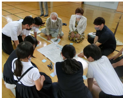
【6月15日 学校運営協議会】