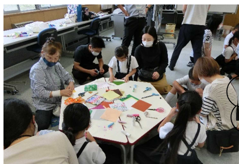
【6月24日 七夕飾り作り】