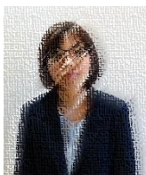
教科：社会 3年副担任 田布施中学校より