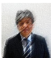
教科：社会 3-1担任 室積中学校より

このたびの異動により3名の教職員が着任しました。1日も早く慣れ、かみのせき學苑の子どもたちのために力を発揮していきたいと思っております。どうぞよろしくお願い申し上げます。