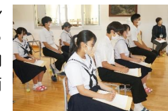
メモを取る姿が真剣を物語ります