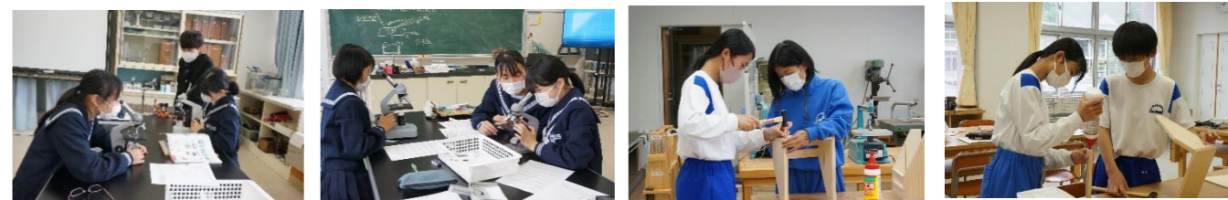
1年:理科 2年:技術 3年:数学

これからも行事や講演会に合わせて学校公開を行っていく予定です。時期が近づきましたら改めてご案内いたしますので、ご都合がよければ、ぜひご来校ください。