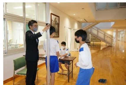
やはり、男女ともに一番気になるのは身長のように

4月25日(火)に身体測定を行いました。毎年、この日には一喜一憂する姿が見られます。本校の昨年度の最高値としては、1年間で身長が9.8cm伸びた生徒もいました。1年間での成長と健康状態がわかる日です。視力矯正や、虫歯治療等のお願い文書が届いた場合は、お手数をおかけしますが、かかりつけの病院への受診をお願いいたします。 ※ 健康面でのご質問がありましたら、保健室(担当:谷村)までご相談ください。