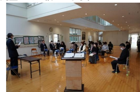
委任状・教員を含め、32名の出席がありました

総会後の学級懇談と部活懇談では、担任(主顧問)、副担任(副顧問)との顔合わせと、学級(部活)経営方針などの説明、情報交換を行いました。これから1年間、宜しくお願いいたします。学年の様子や活動予定、報告につきましては、学年だよりでもお伝えします。