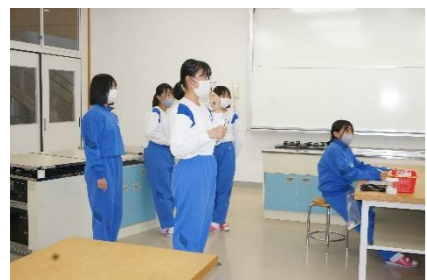
順番待ちでも前が気になります