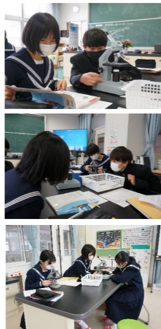
1年生の授業から(理科)