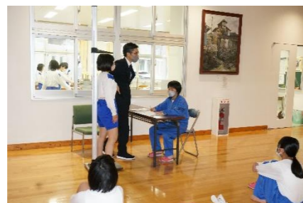
検査機械に表示された輪の切れ目を答えます