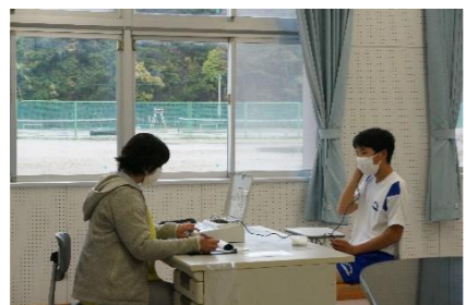
聴力検査は静かな教室で1人ずつ行います