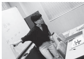
▲広島にて スマホ撮影講座

個人としても年に1度、東京北区にある青猫書房という子ども絵本屋さんのギャラリーで、写真展を開催しています。2016年の初めての個展「つなぐ」では、助産院で撮影した妊産婦さんと家族の様子を、翌年の「つなぐ (Part2)」では、祖母の葬儀の家族の様子を展示しました。命が生まれる瞬間と、家族が旅立つときの両方に立ち会ったことで、生と死は同じ直線上にあり、日常にあること、またどちらも家族の大切な時間だと再認識する機会となりました。今年も11月の写真展に向け、準備を始めたところです。