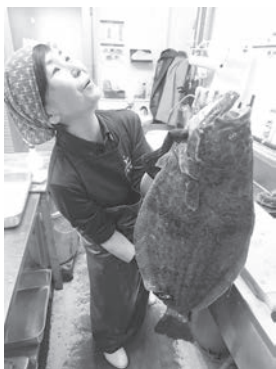
▲上関海峡で、大きなヒラメに大興奮(笑)

今後はカメラマン、ライター、魚のこと、また海外駐在中に身につけた英語力やコミュニケーション能力を掛け合わせ、スーパーマルチで活動の場を広げていきたいと思っています。