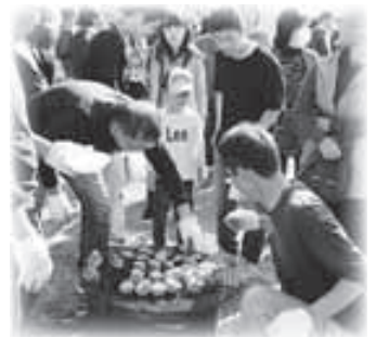
▲すいぐん市も盛り上がってます！