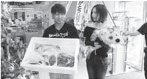
▲道の駅50万人目のお客様！