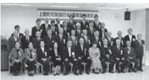
▲町制60周年記念表彰者の皆さん