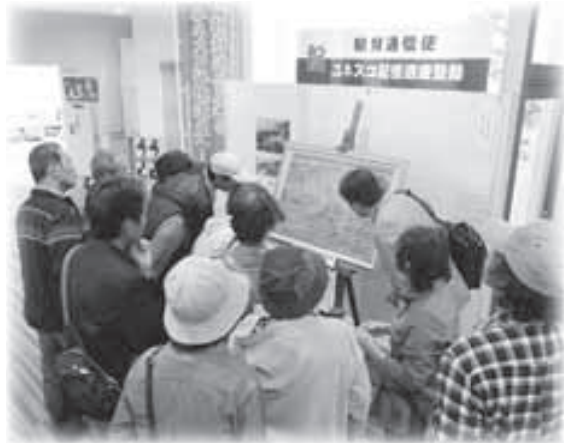
▲本物をひと目見ようと、多くの方が来場！