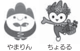
やまりん ちよるる 山口ゆめ花博 検索

※詳しくはホームページまで http://yumehana-yamaguchi.com