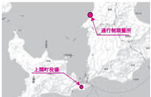
※この地図は、国土地理院の地理院地図（電子国土 Web）の一部を掲載したものである。