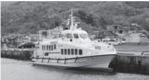
▲新造船「いわい」が就航