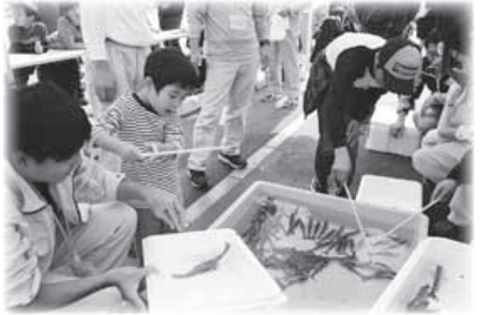
▲大人気的車えび釣り「釣れたあ〜！！」

11月3日（祝）、第29回愛・ランドフェアが開催され、会場の駅前海峽周辺や総合文化センターは、延べ5,000人ももの来場者で賑わいました。 今年は町制施行60周年を記念して町内各地区や学校に記念樹（河津桜・ビャクシン）を配布することになり、オープニングの水軍太鼓演奏の後、町長から上関小・中学校の児童・生徒代表者に、苗とプレートが手渡されました。 総合文化センターでは、各団体の作品展示のほか、ステージイベントとして保育園児の遊戯やJ・FELLOWのダンス、上関中全校生徒の合唱、芸能祭などが行われました。また、朝鮮通信使のユネスコ記憶遺産登録を記念して、「朝鮮通信使船上関来航図」の原画が展示され、多くの観覧者が来場しました。