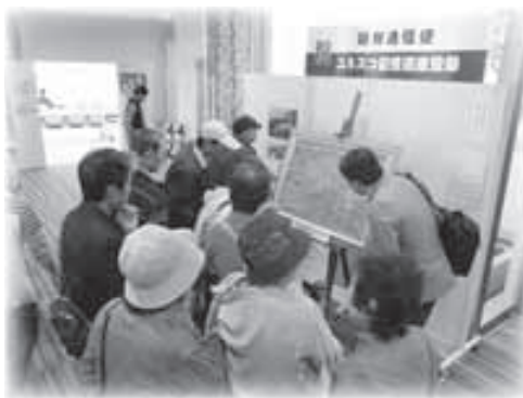
▲今年の愛・ランドフェアには来航図の原画が展示されました

来年秋には、朝鮮通信使ゆかりのまち全国交流会が上関で開催されます。そして、ユネスコ記憶遺産登録を機に、1人でも多くの方が上関を訪れ、この来航図を見ながら江戸時代にタイムスリップして、歴史の一場面を空想しながら上関の町を散策していただきたいですね。