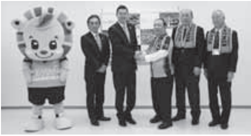
▲レノファ山口のホームタウンに