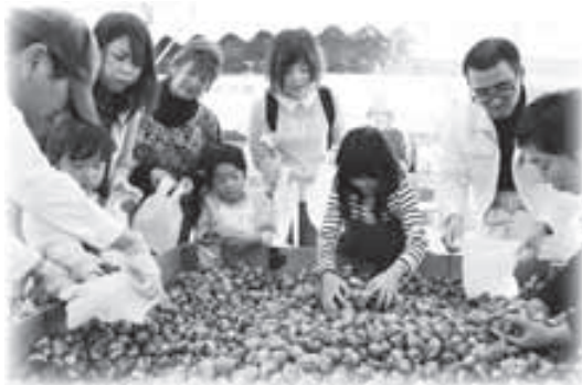
▲いっぱいゲットするぞ〜！