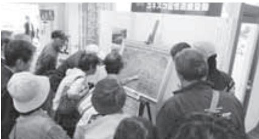
▲朝鮮通信使がユネスコ記憶遺産に