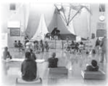
▲祝島小体育館での「冬眠ピアノお目覚めコンサート」

このアートフェスティバルでは、島の方々にどんどん参加していただき、と作品を募ったところ、島のおばちゃんや若者たちが切り絵や刺繍、絵画などを持ってきてくれて、参加型の自由な表現の場を設けることができました。