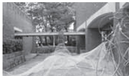
▲県美展出展作品「漁民のうた」

この県美展への出展で、祝島アートフェスティバルのことを多くの方に伝えることができ、ここでもまた発展していきそうな繋がりがうまれます。