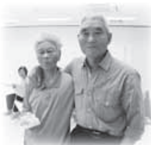
◀男女個人1位で 仲良く記念撮影

終了後、参加者から「初めて話をする人もいて、いい交流になった。今度道の駅で出会っても、気軽に声が掛けられるね」との感想がありました。