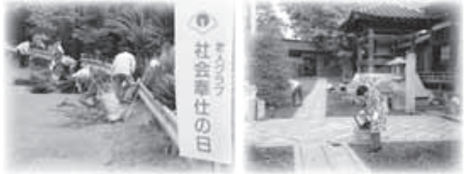
▲上関東部八千代会（住吉神社）