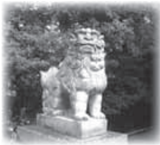
▼力強い獅子がお出迎え