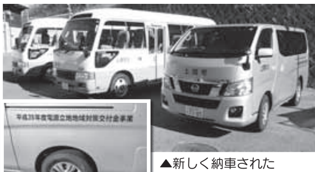
▲新しく納車された スクールバス3台

この度、上関小・中学校のスクールバスを購入（マイクロバス2台、ワゴン車1台）し、1月6日（金）に納車されました。これまで使用していたマイクロバスの老朽化によるもので、平成28年度電源立地地域対策交付金事業で購入しました。