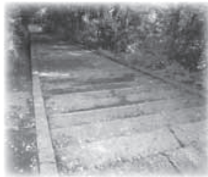
▲白井田八幡宮へと続く階段

白井田八幡宮。この階段は吸い込まれるような奥行きに見え、とても神秘的だ。老木もだが若木も多くあり、木々が周りを囲み、守っているように見える。亀甲。肉厚で力強い獅子。その少し奥にも獅子が居るが、これはどういふことか。