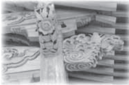
▲四代八幡宮拜殿の彫り物