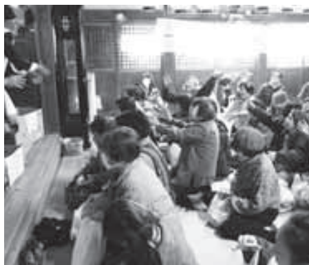
▲こっちにもお願い!!

白井田八幡宮でも、2月3日の節分の日に、恒例の豆まきが盛大に行われます。今年も、60名あまりの参拝者が訪れました。