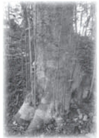
▶蒲井。老木からは新たな芽吹きが

蒲井八幡宮樹林。木漏れ日が、何とも言えない柔らかな光で地を照らし、道無き道には幾つもの木の根が這っている。老木からは新たな芽吹き。木はまたそこから再生を繰り返す。ここは、なんだかトトロが昼寝でもしていそうな、緩い時が流れる場所だ。森林浴に興味がある人にはお勧めである。