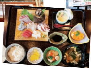
お食事処 関亭 (鳩子の湯内)

【住】上関町大字室津924 【営】10:00～21:00(入浴受付は20:00まで) ☎0820-62-1126 【休】毎月第3水曜日