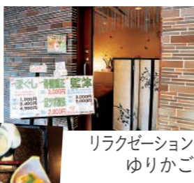
リラクゼーション ゆりかご