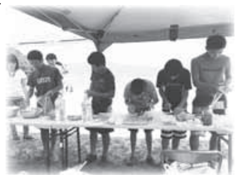
▲カレーの準備。子供たちも真剣です！