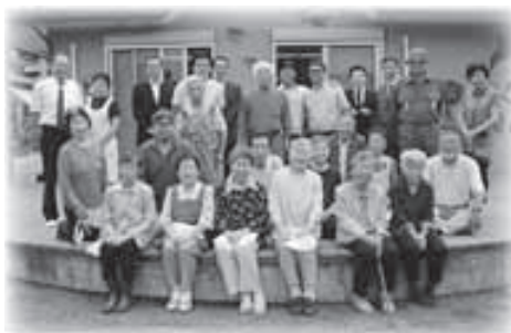
▲来年も元気で会いましょうね！

くれるので、こうして何とかやっちよるよ。」 高齢化率が9割近い八島では、住民同士の助け合いが不可欠なんです。