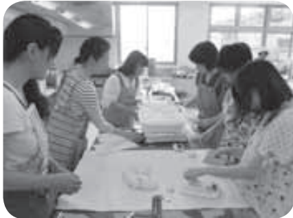
一緒に作るのも楽しいですね！