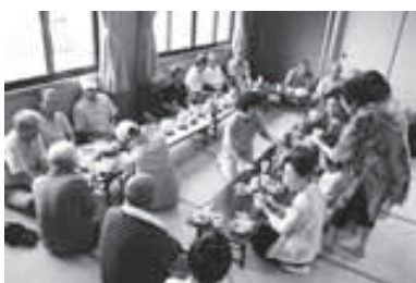
◀ちょっとひと休み