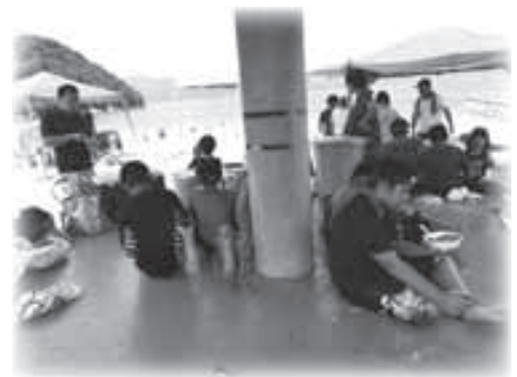
▲みんなで食べると「美味し〜い！」

クルージングでは、船の上にいる子供たちの楽しそうな声が、浜辺まで聞こえてきました。バーベキューは、手慣れた大人の方たちが直ぐに火をおこしてくれて、子供たちは美味しそうなお肉をほおばっていました。