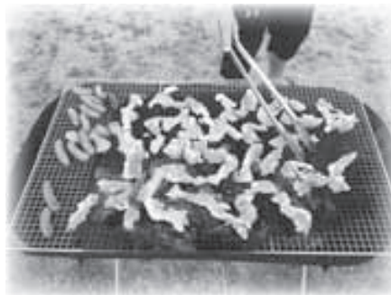
▲早く焼けないかな〜・・・