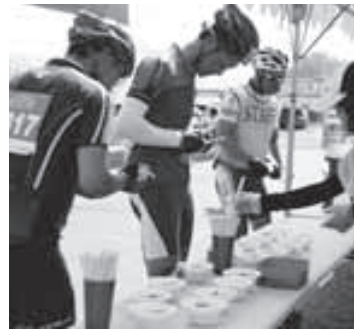
▲海鮮鍋も好評です