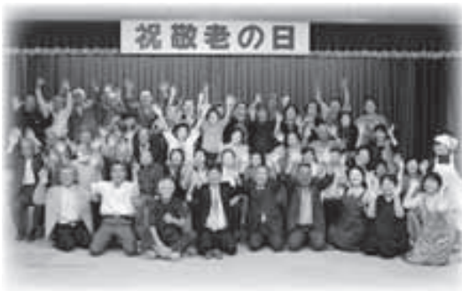
▲みんなで『バンザイ！』

参加者の中では最高齢だという88歳の女性が、帰り際に「私の親が100歳まで長生きしたんですよ。私も頑張らんとね。」と笑顔で話してくれました。