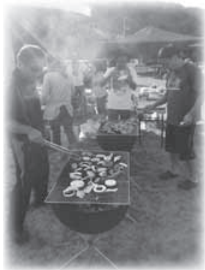
▲夏の定番！ バーベキュー