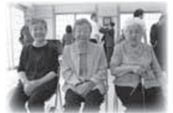
▲本日主役の三人娘

2部がスタートです。ふれあいセンター横の広場では、ボランテイアグループ「遊友会」のみなさんによる楽しい歌や踊り、フラダンスなどが披露され、観客も一緒になって歌ったり踊ったり。最後の演目の「河内おとこ節」では、遊友会の皆さんの踊りに合わせて全員が鳴子で拍子を取り、会場がひとつに。笑顔で楽しいひとときを過ごしました。