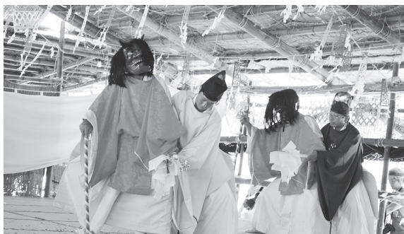
祝島の神舞神事 (2012年)

人口減少や後継者不足など、保存・伝承が難しくなってきたことは事実。地域の方々の力で保存会を立ち上げ、地域密着型の行事として実施し、それを町がサポートするなど、今後でもできる限りの協力をしていく。地域の伝統文化の保存・伝承については、教育委員会において、観光協会や商工会などの関係機関とも連携を図りながらどのようなサポートができるか検討していく。