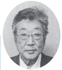
山戸 貞夫 議員