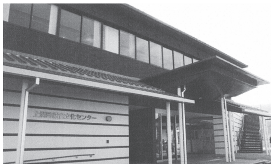
新しい公民館（総合文化センター内）