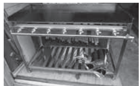
▲イベント用ガス式鉄板