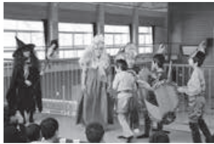
▲シンデレラならぬ「リンデレラ」