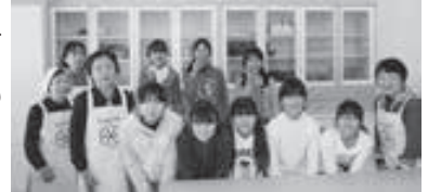
▲最後は笑顔で、「ハイ、チーズ!」