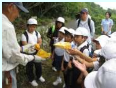
びわ収穫体験活動