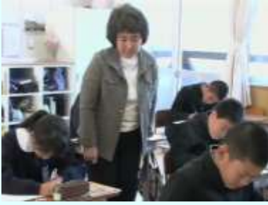
中学校教員による 小学校への乗り入れ授業