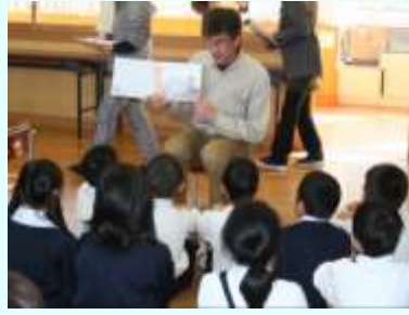
小学校 1 年からの外国語活動 (教育課程特例校)