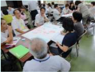
学校運営協議会による熟議