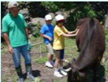
牧場・農業体験活動