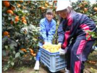
みかん収穫体験活動 (小4・中2)