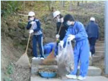
清掃ボランティア活動 (小6・中1)