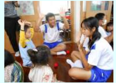
保育園との交流活動