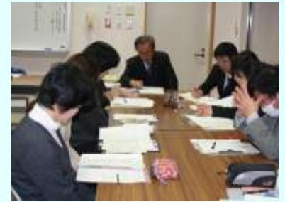
小中一貫教育研修 (小中合同校内研修)