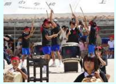
小中合同秋季大運動会