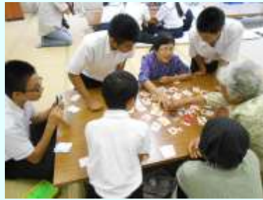
地域のお年寄りとのふれあい活動