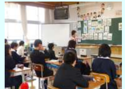
地域の方を講師に招いた租税教室