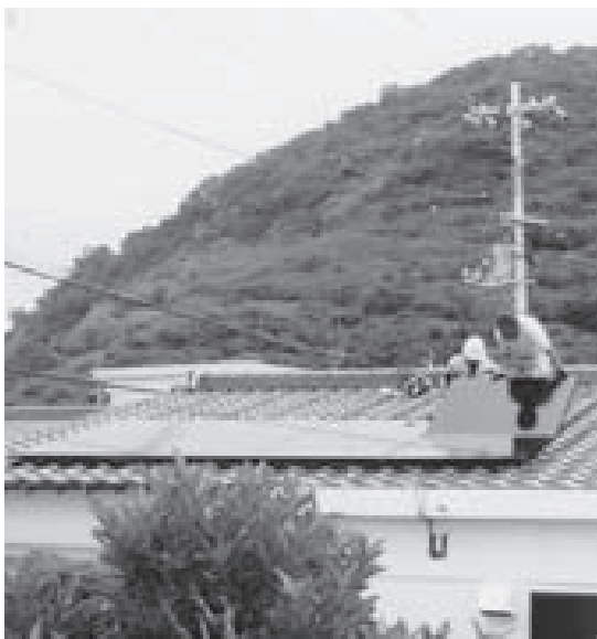
太陽光パネル設置作業（祝島）

のか、それによる町の税収はどの程度見込まれるのか、地域におよぼす経済効果の数値的なものも無く、慎重にならざるを得ない。今後地域ビジョン検討会で概念ではなく数値を示してもらいたい。