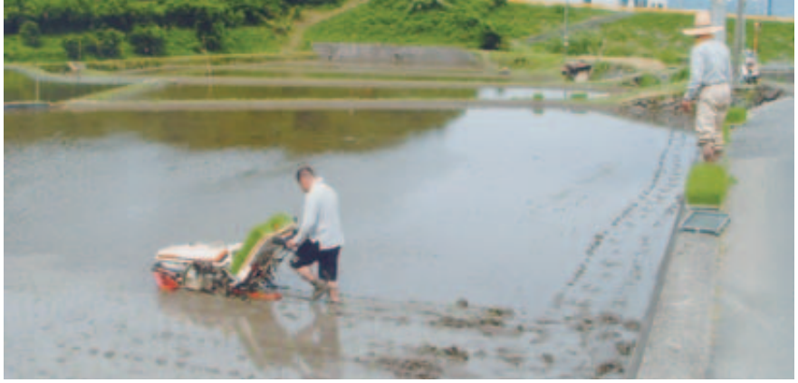
豊作を願い田植え（志田）