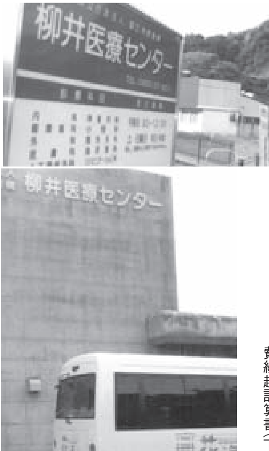
柳井医療センター