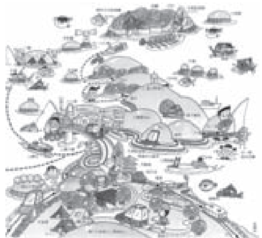
上関町イラストマップ

検討会の意義は、原子力立地の賛否や立場を超え、これを基本姿勢にして直面する課題とそれを解決する方策について検討を重ねていき、ある程度の方角が示せる状況になって、議員の皆さんに町民参加を求めるか否かを相談したい。第5回以降の検討会については、緊急性や必要性を考え、財源不足にどう対応していくのか議論したい。