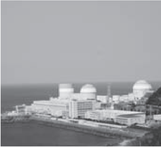
伊方原子力発電所（愛媛県）

子力発電所に関し、避難計画を盛り込んだ地域防災計画の見直しが必要となれば、当町においても県と連携をとりながら地域防災計画の見直しを行うことになる。