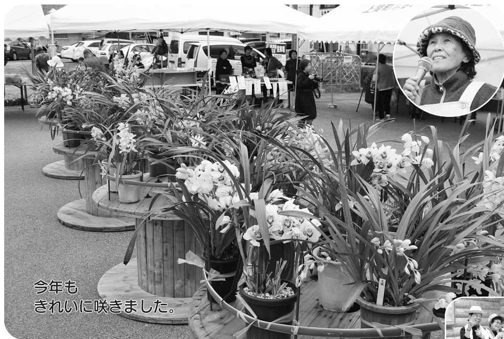
今年も きれいに咲きました。

ひなの里よりあい館では、日本舞踊やカラオケも披露され、観客は盛んに拍手を送っていました。また、今年は最後に餅まきも行われ、子供からお年寄りまで、笑顔いっぱい、大いに盛り上がりました。 早いもので、この『らん蘭まつり』も今年で17回目を迎えます。丹精込めて育てた蘭の花を、少しでも多くの方に楽しんでもらおうと、地元の有志による『ミニ蘭展』を開催したのが始まり。今では、上関の春を代表するイベントのひとつとなっています。 手間を掛ければ掛けるほど、美しい姿を見せてくれる蘭の花。お世話は大変ですが、ぜひこれからも私たちの目を楽しませてくださいね。