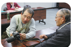
先生から指導を受ける会員

今ではすっかり花も散ってしまいましたが、次は新緑が芽吹き、鮮やかな若草色が山を少しずつ染め始めています。