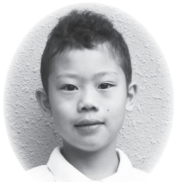
あかいしりょう たるう