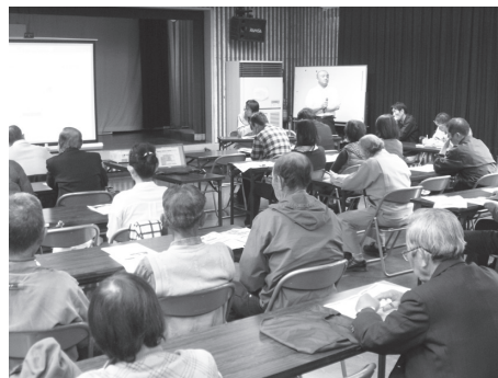
▲農産物・加工品部門