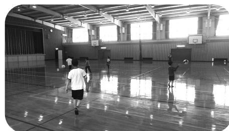
『終了後ボール遊びを楽しむ子どもたち』

4月27日(日)、第1回エンジョイスports教室の開講式がありました。今回は風が強かったため、町民体育館で大人対子どもによるティーボールを行いました。ティーボールとは、投手のいない野球ゲーム、といったところ。力いっぱいバットを振ると、セットされたボールが音を立てて勢いよく飛んでいきます。大人には厳しい(?)ハンデもあり、子ども相手に大苦戦!結果は子どもたちが圧勝しました。