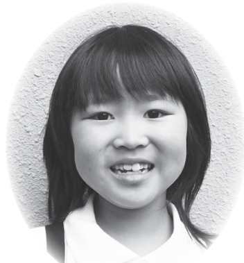
やま と めぐみ