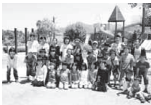
地域の力で企画された活動

した。この「地域の力」を活用した地域づくりは、総合型クラブに限らず、地域のお祭り・七夕飾り・ひな祭り・ハロウィンなどを開