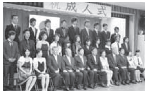
昨年の成人式の様子